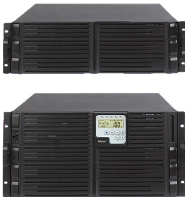
Element RT 3/1

Produktová podpora naší společnosti vám navrhne řešení zálohování přesně podle vašich potřeb.